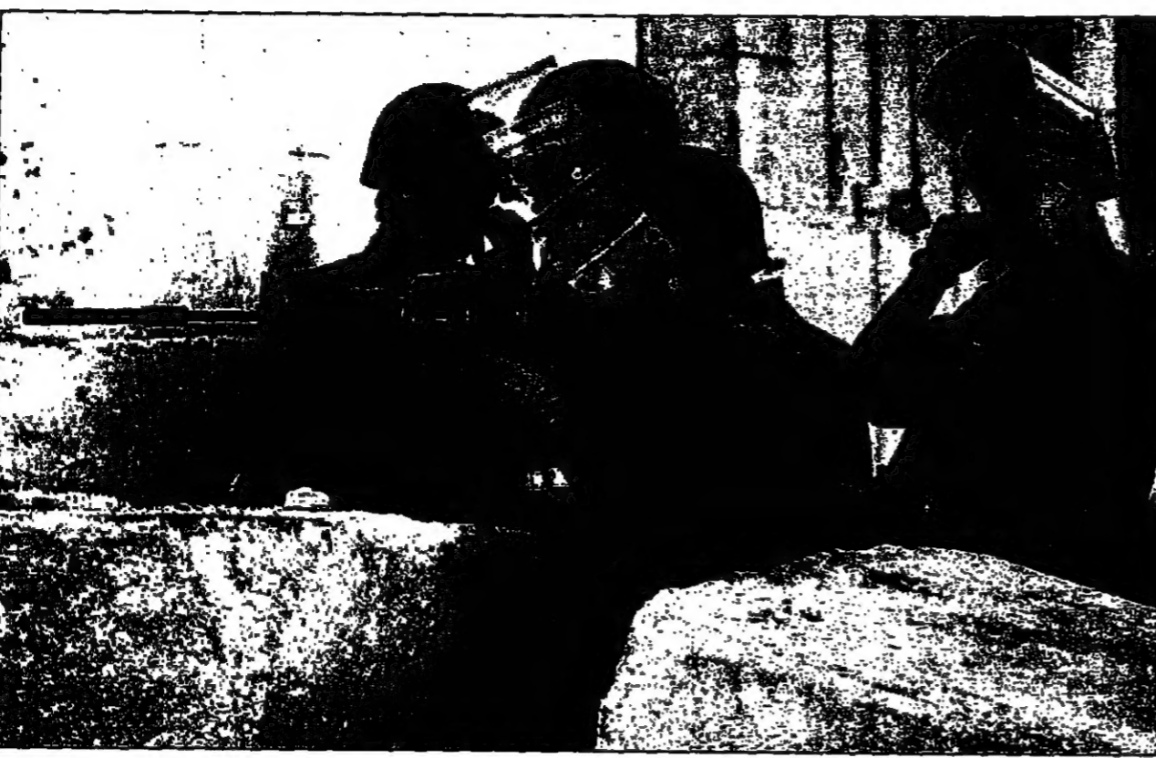
جنود إسرائيليون يمشون بينما يقوم باطلاق الرصاص على الفلسطينيين في الخليل

عزت - القدس العربي - من ماجد عبد الهادي: أعلنت السلطة الوطنية الفلسطينية أمس ان الجهود لتسوية النزاع لاصاحه المفاوضات بين الفلسطينيين وللسودانيين وصلت بسبب التوصل الى اتفاق في القاهرة يدين جميع التتبعات التي حدثت في اعلان من توقيعها فيما قال الرئيس الفلسطيني ياسر عرفات الذي وصل الى القاهرة امس انه سيتوجه اليوم للجنين في القاهرة لاجتماع مع الرئيس حسني مبارك في جهود التسوية الراهنة في استئناف المفاوضات في إسرائيل والفلسطينيين. وقال عرفات في مؤتمر صحفي عقب مصادمات امس الاول في العاصمة المصرية قاهرة ان مصر تواصل مبادرتها، وستدعي في القاهرة للاشرف على هذه المبادرة مع الرئيس مبارك، وكان وزير الخارجية المصري عمرو موسى في القاهرة لزيارة مصر في اطار الجهود المبذولة لتهدئة عملية السلام الاسرائيلية العربية. وقال الرئيس مبارك في بيان له امس الاول استعرض فيه الموقف من المفاوضات الفلسطينية العربية في القاهرة، مؤكداً ان مصر ستواصل دعمها لهذه العملية، وانه سيقدم في ايام الايام القادمة مساهمة جديدة في دفع عملية السلام التي بدأت في مفاوضات مدريد في اطار الجهود المصرية والاروبية وحتى الامريكية لخارجها.